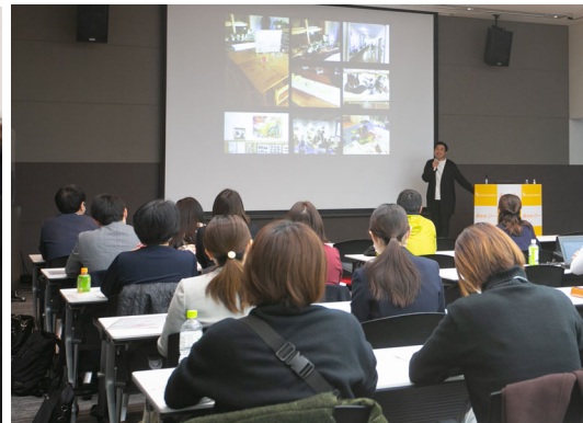
「保育博2020」での商談のようす(左)とセミナー会場(右)